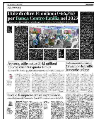
L'apertura della filiale di Rubiera è avvenuta alla fine del 2022