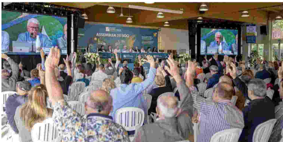
Il momento della votazione durante l'assemblea che si è tenuta a Casumaro in provincia di Ferrara

Oltre alla distribuzione del dividendo ai soci, nel corso dell'assemblea sono state approvate le iniziative "fondate sul bene comune" sostenute attingendo al fondo di beneficenza: «Il fondo – ribadisce il presidente Accorsi – permette di concretizzare progetti con finalità sociali e ambientali: dalle borse di studio destinate ai nostri giovani soci o figli di soci per premiare i loro traguardi negli studi fino alle iniziative benefiche per il territorio».